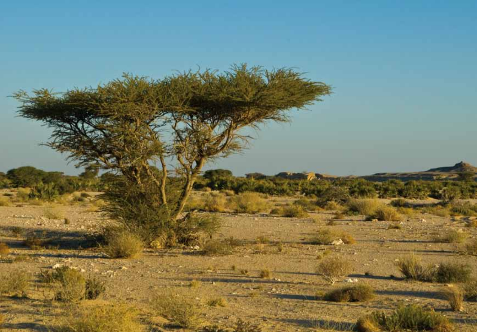
Wadi Rabkut. En härlig morgon. December 2008.