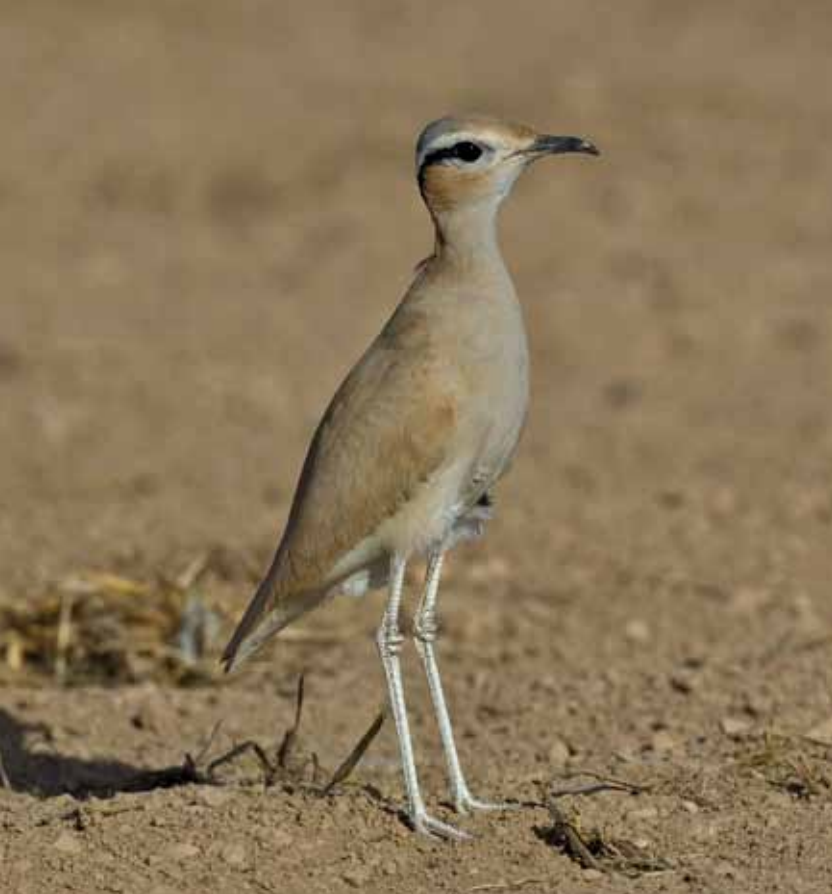
Ökenlöpare Cursorius cursor , ökenart som kanske är lättast att hitta på jordbruksmark. Jarziz Farm, februari 2009.

Om man startar från Salalah riktigt tidigt så hinner man till Wadi Rabkut innan solen går upp, så att man får några givande morgontimmar i denna vackra ökenwadi med spridda palmer och akacior. Det är inte tätt mellan fåglarna men med lite ansträngning och en smula flyt kan man jobba sig igenom ökenhöna, stenökenlärka, härfågellärka, ökenstenskvätta, ökensångare och arabskriktrast.