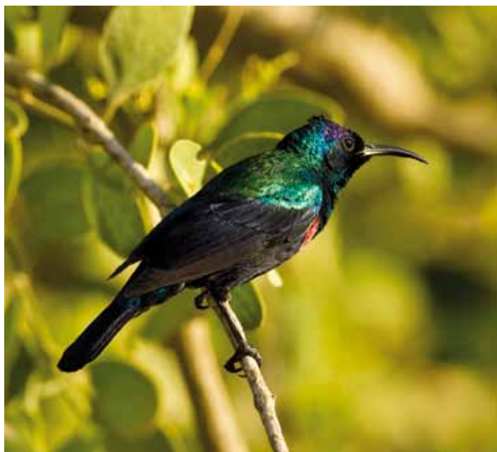
Mötet med en utfärgad solfågelshanne kan lätt ta andan ur en. Abessinsk solfågel Nectarinia habessinica , Oman, december 2008.

Båda har mycket förnämlig hotellservice men Hilton är nog strä-tet vassare och Hiltons mat är helt enkelt utsökt för att vara ett hotellkök. Hilton ligger just väster om staden vilket gör att hotellet ligger bra till för två av områdets bättre fågellokaler, soptippen och Mughsayl.