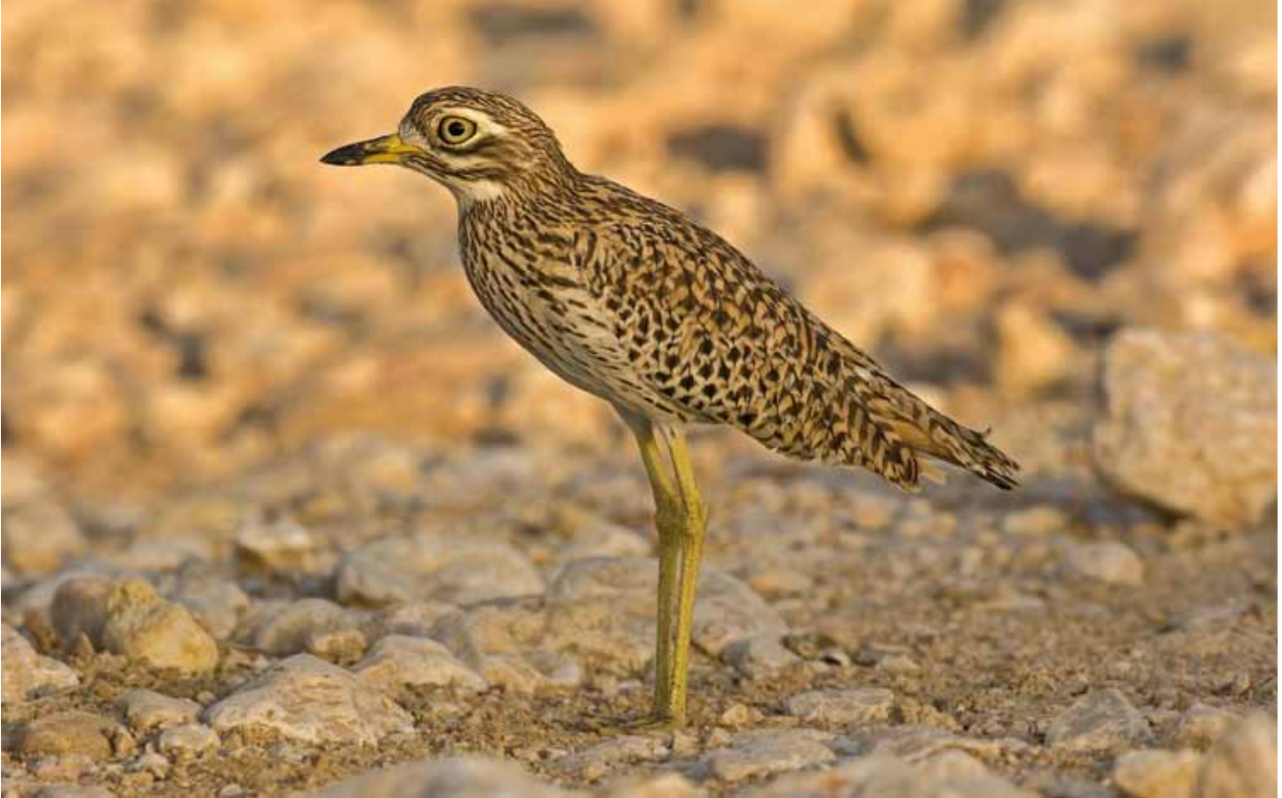
Fläcktojockfot Burbinus capensis. Ständigt cool som alla tjockfötter. Al Balid Archaeological Park, februari 2009.

tet gång av den vanligen svårsedda fläcktojockfoten höll till runt museet vintern 2008/09.