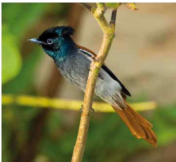
Afrikansk paradisflugsnappare Terpsiphone viridis är ganska lätt att hitta i den frodiga, gröna miljön runt de olika källorna. Oman, januari 2009.