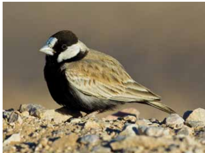
Svartkronad finklärka Eremopterix nigriceps . Småflockar ses på många håll i öknen. Oman, december 2008.

Fiskmarknaden och souken i Salalah har redan nämnts. I Salalah finns dessutom sedan några år ett stort arkeologiskt område utgrävt strax väster om Crowne Plaza Hotel, Al Balid Archaeological Park . Speciellt Frankincense Land Museum, "Rökelselandets museum", är mycket sevärt med sin moderna, tilltalande utformning. I trädgården växer också några rökelseträder som en backup för den som inte hittar några i bergen. Glöm inte kikaren för i en kanal inne på området kavar skäggtärnor av och an och i ett blommande träd strax intill toalettbyggnaden samsas området båda solfåglar. Ett li-